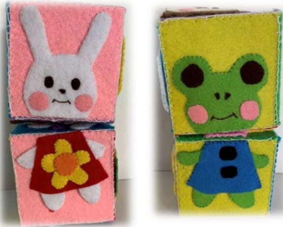
えあわせさいころ