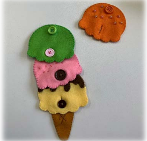
アイスクリームどのおじにする？