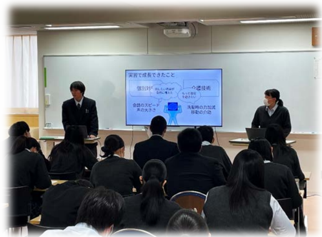
↑ 大人数を前に、緊張感ある発表でした…！