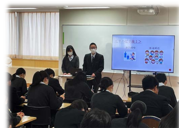
↑ 聞き手を飽きさせないように、クイズ形式で☆