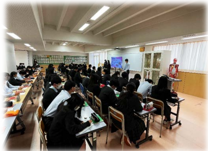
↑ 普段は聞けない他学年の発表に、前のめりに！