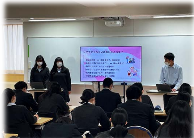
↑ 「スライド」を作成し、プレゼンを行います♪