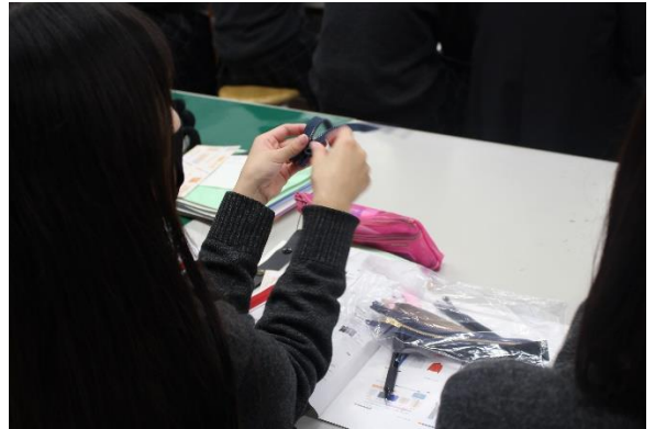
機能性のあるファスナーを体感