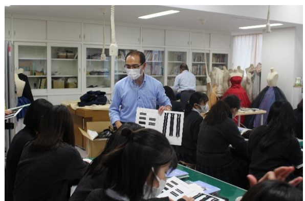
高級なファスナー