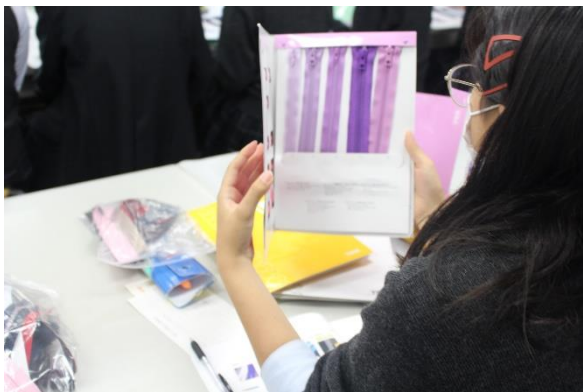
種類別のファスナー