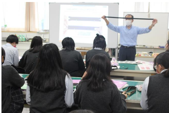
伸びるファスナー