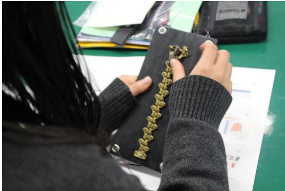
世界初のファスナーのレプリカ

YKK 株式会社様にお越しいただき、衣服材料について、講義をしていただきました。ファスナーといってもお馴染みのチャックからボタン、ハトメ、テープなど様々な機能や種類があり、実物に触れ種類別の機能や品質を実感することができました。今後の発展的な制作物に期待しています。